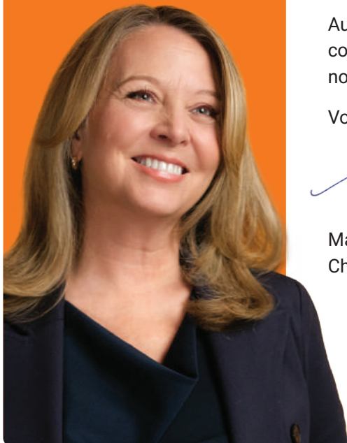
Marit Stiles, Cheffe du NPD de l'Ontario

Voici les engagements que je prends envers vous.